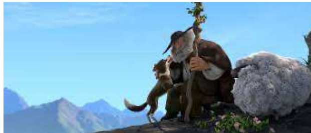
Après la pluie