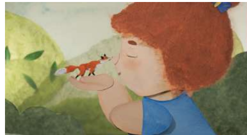
Le renard minuscule