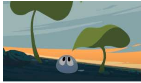
Goutte d'eau