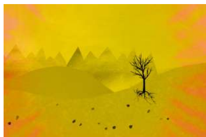
Sur la colline