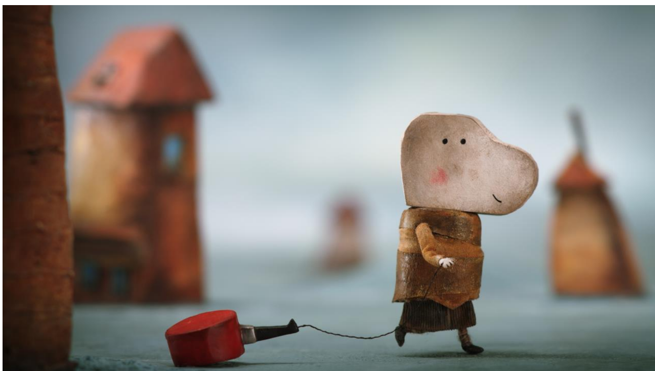
La petite casserole d'Anatole

Ciné concert à partir de 3 ans (40 minutes)