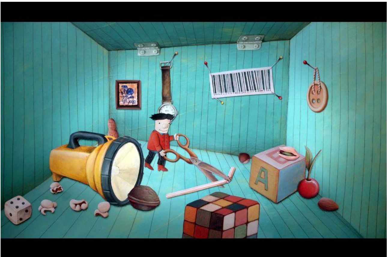
Le petit bonhomme de poche

Le réalisateur : Gottfried Mentor est un animateur et réalisateur allemand, né en 1981 à Strasbourg. Il est diplômé de la Film Academy Baden-Württemberg avec le court métrage d'animation Oh Sheep! (Lammer, 2013). Il a travaillé pendant de nombreuses années au cinéma et à la télévision.